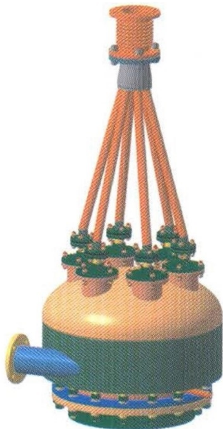
3D модель установки ГПУСМ